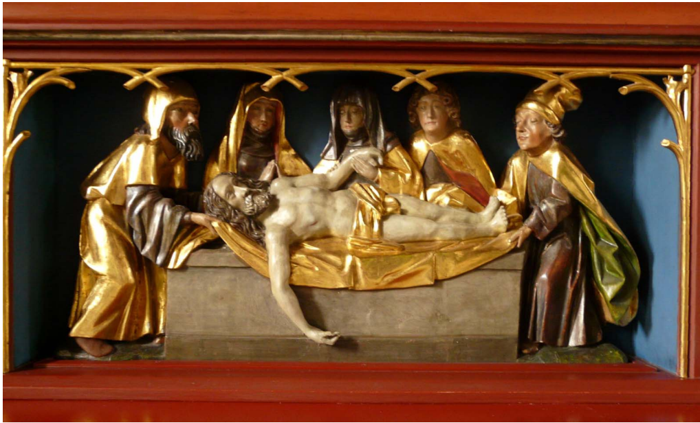
Beweinung Christi (um 1500)