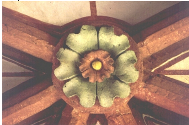
Schlussstein im Chorraum