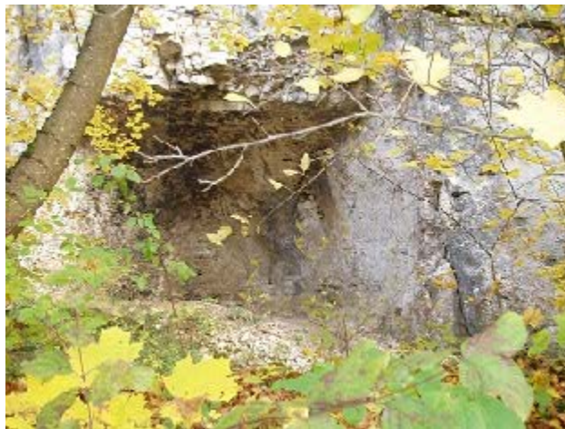
Höhle in der Hilzernen Klinge im Herbst ...