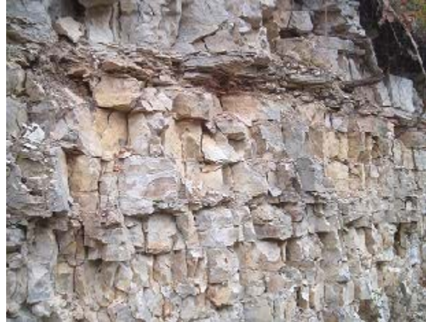
"Thorleite-Schichten" an der Straße nach Mönsheim

Erdgeschichtlich besonders bedeutsam sind im Dollnsteiner Gebiet die "Thorleite-Schichten" des Malm Epsilon, die geologisch und zeitlich zwischen den Bankkalken und Plattenkalken einzuordnen sind. Mehrere hundert Meter dieser Schichten sind am Westhang der Thorleite an der Straße Hagenacker - Altendorf und in kleinen aufgelassenen Steinbrüchen im Wald darüber aufgeschlossen. Während sich in den unteren Schichtpaketen bevorzugt dickere, gelbbraune Bankkalke finden, besteht der obere Bereich aus dünnbankigen und durch feine Mergelfugen getrennten Kalkschichten von gelblichweißer Farbe. Die Thorleiteschichten enden an einer sehr auffälligen, ca 20 cm dicken, roten Mergellage. Aus dieser „Roten Lage“ konnten zahlreiche gut erhaltene und wissenschaftlich höchst interessante Fossilien geborgen werden.