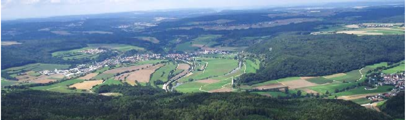
Blick auf den Dollnsteiner Talkessel und die umliegende Hochfläche

Das niedrige Mittelgebirge der Altmühlalb - die höchsten Erhebungen im Gemeindegebiet liegen bei 550 m, der Talgrund bei knapp 400 m - ist geprägt von einer reizvollen Vielfalt: Die wellige Jurahochfläche und tief eingeschnittene Täler, ausgedehnte Wälder auf der Hochfläche und Dörfer inmitten von mittelalterlichen Rodungsinseln, dunkle Buchenwälder und weiß leuchtende Dolomittfelsen, mit Wacholder bestandene Steppenheiden und grüne Talwiesen, das wasserreiche Altmühltal und wasserlose Trockentäler, klare Karstquellen im Tal und Wasserarmut auf der Hochfläche bestimmen den Charakter der Landschaft.