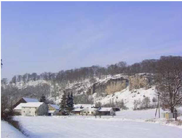
Die Dohlenfelsen bei Hagenacker