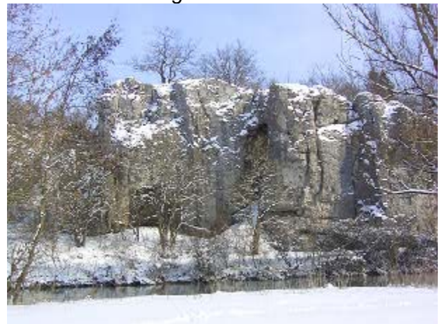
Felsen in der „Hilzernen Klinge“

Auch die Schichtkalke entstanden im Jurameer. In den schüssel- oder wannenförmigen Teilen des Meeresbodens, die durch das Wachstum der Schwammhügel entstanden waren, lagerte sich in dünneren oder dickeren Schichten feinkörniger Kalkschlamm aus Resten kleiner und kleinster Meereslebewesen ab, der im Laufe der Jahrtausende "versteinerte". Die dickbankigen, tiefer liegenden, durchschnittlich einen Meter mächtigen Schichten werden als Bankkalke bezeichnet und als Juramarmor verkauft. Die dünneren und höher liegenden, wenige Millimeter bis 30 cm dicken Schichten, sind die berühmten "Solnhofener Plattenkalke". In die Bank- und Plattenkalke wurden zahlreiche damals lebende Pflanzen und Tiere eingeschlossen, die heute beim Abbau als Fossilien (Versteinerungen) gefunden werden. In allen Schichten kommt als Leitfossil der Ammonit vor; an ihm kann man