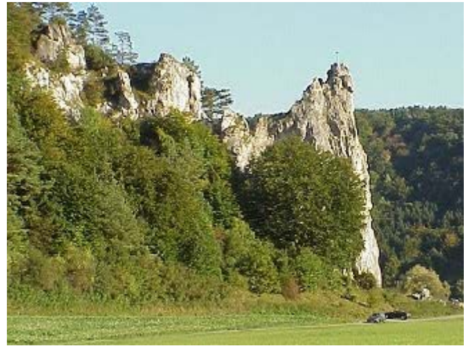
Der markante Burgsteinfelsen zwischen Dollnstein und Breitenfurt, einer der bekanntesten Felsen im Altmühltal, zählt zu den 100 schönsten Geotopen Bayerns