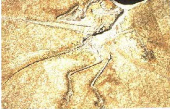
Der "Archäopteryx", das berühmteste Fossil aus der Jurazeit

das Alter der Schichten bestimmen. Weil er so wichtig ist, wurde er als Erkennungszeichen des Naturparks Altmühltal ausgewählt. Bankkalke sind im Gemeindegebiet aufgeschlossen in den Steinbrüchen beim Esslinger Tunnel westlich, im Tiefen Tal nordöstlich von Hagenacker und in der Ortsmitte von Obereichstätt. Nennenswerte Vorkommen von Plattenkalken finden sich im Gemeindegebiet nicht, wohl aber im benachbarten Solnhofen und Eichstätt. Großartige Fossilensammlungen zeigen die bedeutenden Museen unseres Gebietes: das Juramuseum auf der Eichstätter Willibaldsburg, das Museum Berger auf dem Harthof bei Eichstätt und das Bürgermeister-Müller-Museum in Solnhofen.