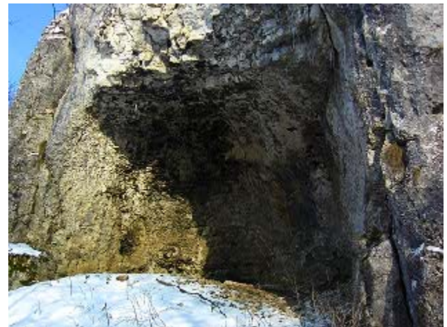
... und im Winter. Wegen ihrer Lage direkt an der Altmühl war sie in der Steinzeit eine "ideale" Unterkunft.

Als sich Urdonau und Altmühl in die Albtafel einschnitten, legten sie an den Talflanken zahlreiche der einst unterirdischen Höhlen frei (Beixenstein bei Ried, Mühlberggrotte in der Nähe der Schule, Lochschlaghöhle zwischen Obereichstätt und Breitenfurt, Pulverhöhle bei Breitenfurt, Höhle in der Hilzernen Klinge u.a). Fast alle diese Höhlen dienten in der Eiszeit den Menschen als Behausung, da damals das Gebiet des Altmühltals frei von Gletschern war.