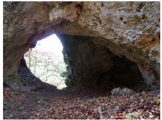
Die Halbhöhle des Beixenstein war zunächst eine auf drei Seiten geschlossene Höhle, ehe sie vom Wasser der Urdonau ganz durchbrochen wurde-