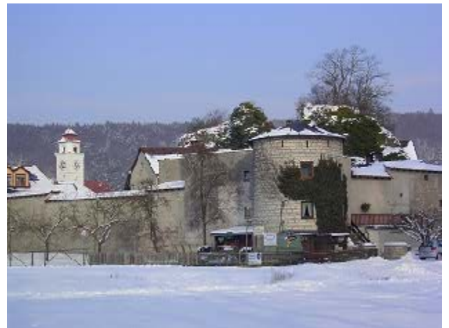
Der Burgfelsen in Dollnstein